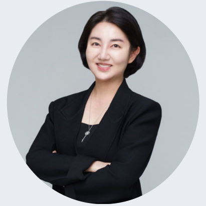
Writing : Heather Oh